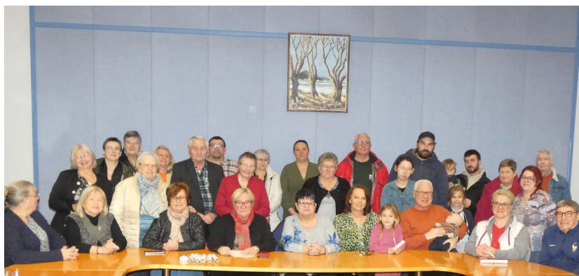
Départ de la tournée du jury