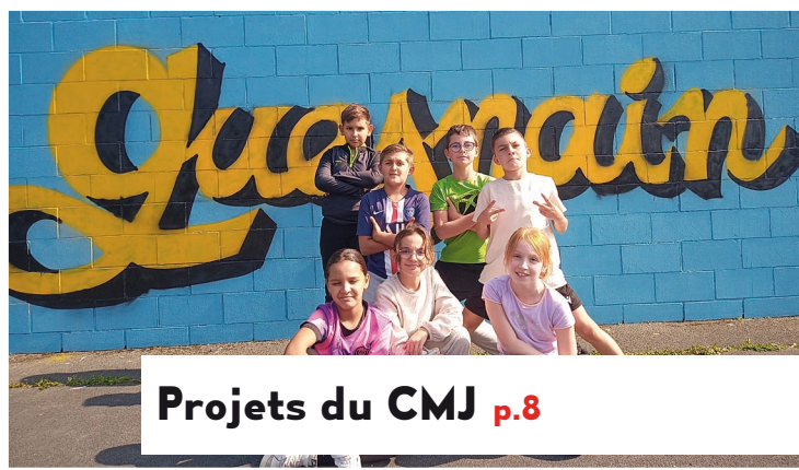
Projets du CMJ p.8