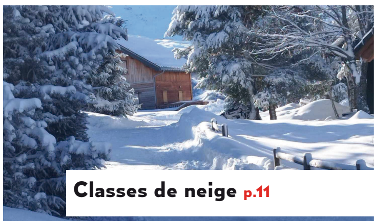
Classes de neige p.11