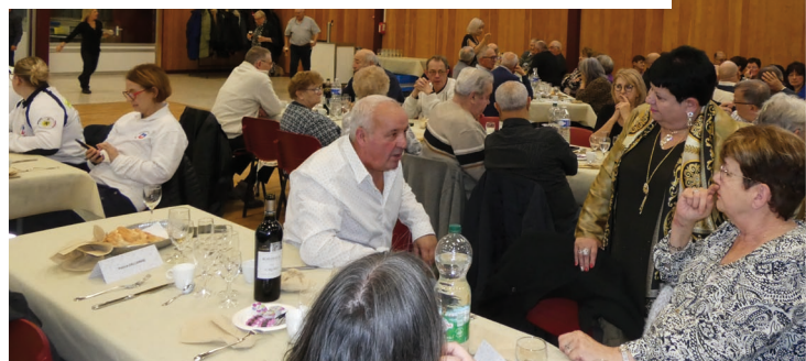
Banquet des aînés p.10